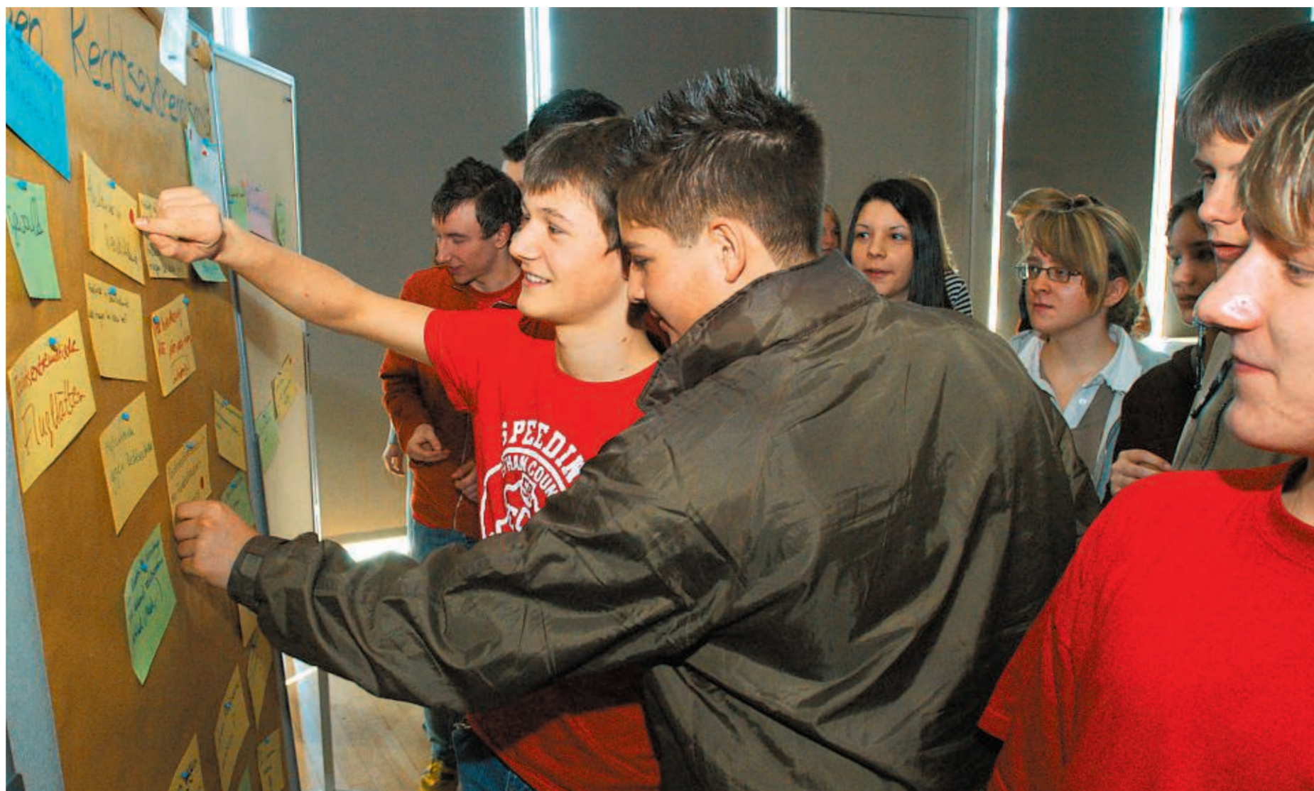
Ganz demokratisch: Zu Beginn des Seminars verteilen die Schüler rote Punkte. Auf diese Weise werden aus über 60 Themenvorschlägen jene ausgewählt, die später in den Kleingruppen behandelt werden. Rund 100 Schüler der Klassenstufe 10 des Lichtwer-Gymnasiums beteiligten sich an dem Projekt – mit dabei auch Bundes- und Landespolitiker.