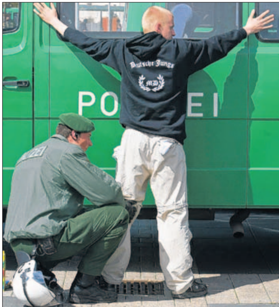
Im Kampf gegen den Rechtsradikalismus bleibt die Polizei nicht alleine. Wichtig sind funktionierende Aufklärungsprogramme, die rechtes Gedankengut vertreiben.