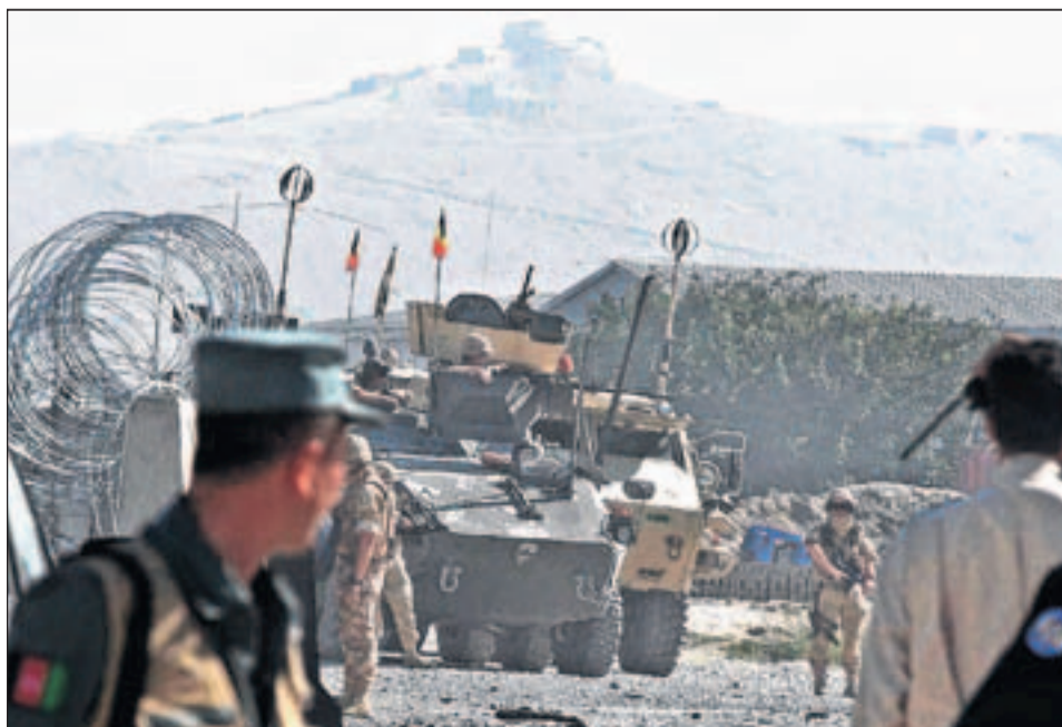
ISAF-Soldaten inspizieren den Ort des Selbstmordanschlags.

Diesmal detoniert der Sprengsatz nicht direkt unter dem Wagen, doch beide Feldjäger-Fahrzeuge werden stark beschädigt.